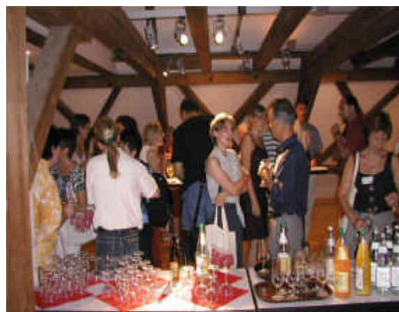
Aufmerksame Zuhörer bei der Projektvorstellung (Foto links) und hinterher beim gemeinsamen Austausch (Foto rechts).