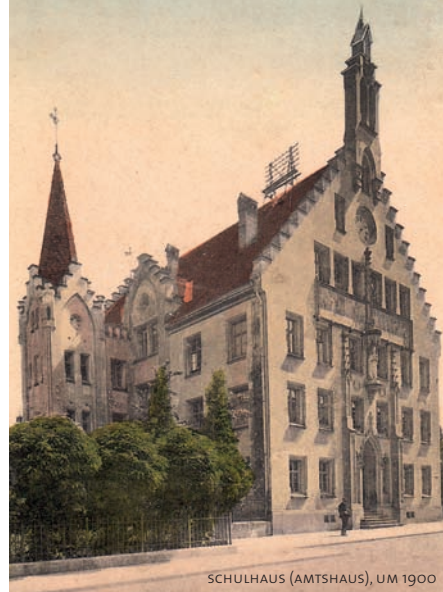
SCHULHAUS (AMTSHAUS), UM 1900

ABB. TITELSEITE: RATHAUS VOR DEM UMBAU VON 1856, GEMÄLDE VON MORITZ JAKOB, UM 1850