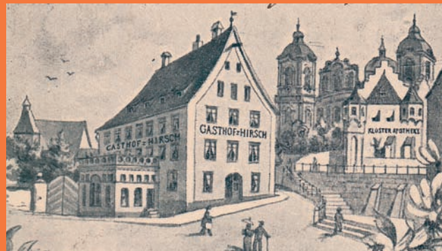
GASTHOF ZUM HIRSCH, UM 1900